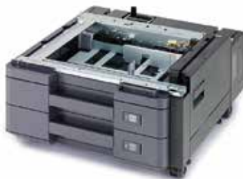
MAGASIN PAPIER 2X 500 FEUILLES PF-7100 Idéal pour les formats A6 à SRA3 (320 x 450 mm).