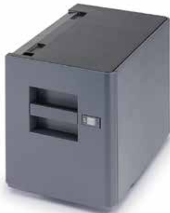
MAGASIN PAPIER 3000 FEUILLES PF-7120 Idéal pour les tirages volumineux au format A4.