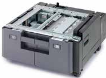
MAGASIN PAPIER 2X 1500 FEUILLES PF-7110 Prise en charge des formats A4, B5 et lettre.